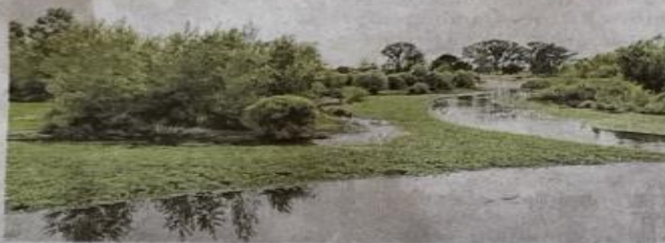
Le site du Petit Fleury (ici l'emblématique méandre qui rejoint la Loire) est le deuxième site du Département à être labellisé Espace naturel sensible.

Mardi, sur la plateforme aménagée à la vue incompara-