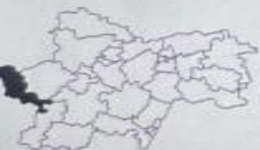
Canton de Digoin