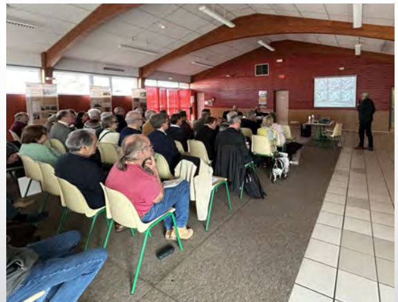
Un public attentif

Pourquoi ce laissé-de-côté volontaire Pourquoi cette procrastination ? C'est peut-être le fait que le monde vivant avec sa part d'incertain, d'imprévu qui font sa richesse rend mal à l'aise une société imprégnée d'une technocratie aveugle à certaines réalités.