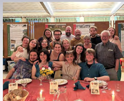
Accueil des québécois (juin 2024)