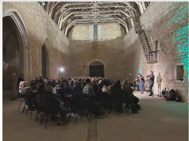
Le concert aux cordeliers, à Saint-Nizier-sous-Charlieu