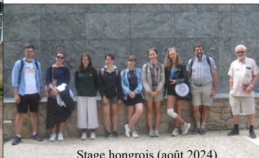
Stage hongrois (août 2024)