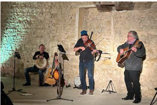
Le Black Velvet Band aux Cordeliers

L'année prochaine, à l'automne 2025 (3-4 -5 octobre), les musiciens du Black Velvet Band seront de retour pour la 27 ème édition du Festival. Retenez cette date dans vos calendriers!