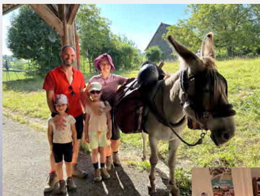
Accueil des randonneurs