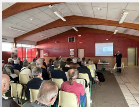
Le colloque (novembre 2024)