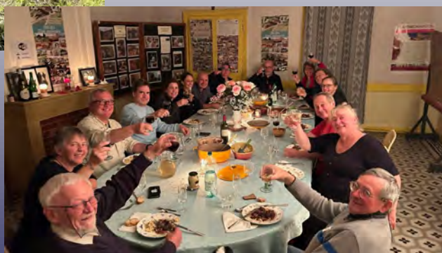
Repas de fête après les concerts du Black Velvet Band