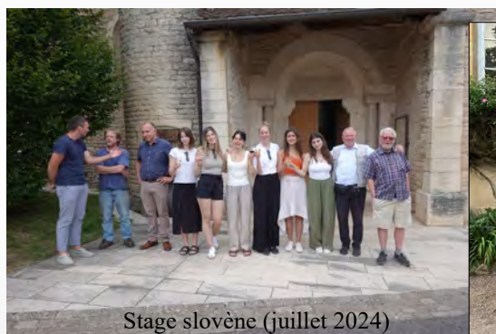
Stage slovène (juillet 2024)