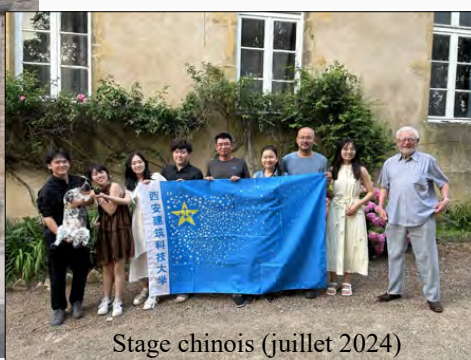
Stage chinois (juillet 2024)