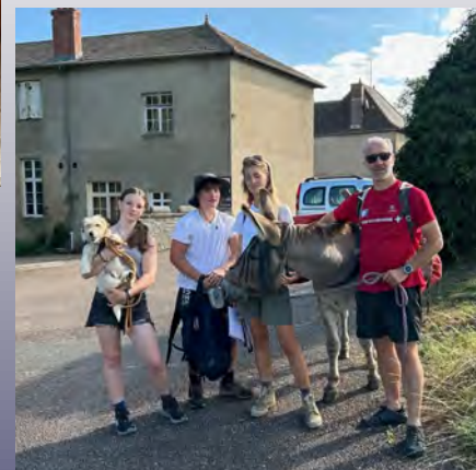
Accueil des randonneurs