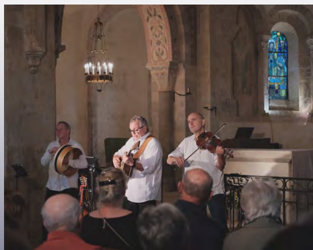
Le concert à l'église d'Iguerande

L'année prochaine, à l'automne 2025 (3-4 -5 octobre), les musiciens du Black Velvet Band seront de retour pour la 27 ème édition du Festival. Retenez cette date dans vos calendriers!