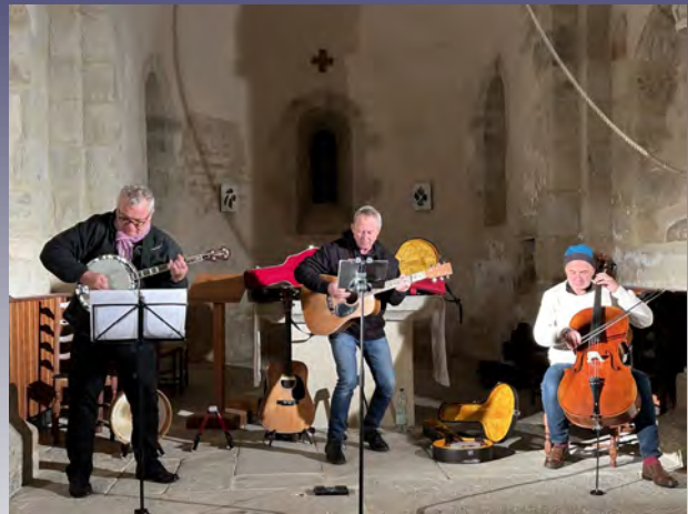
Le Black Velvet à l'église de Saint-Romain-sous-Gourdon

Comme tous les ans, depuis 1998, les musiciens ont enchanté le public. Certains spectateurs viennent tous les ans, à un ou deux concerts. Le Black Velvet Band a trouvé son public. Le festival « Celtique en Voûtes » est devenu l'un des plus anciens festivals en Bourgogne du sud. Il est unique en son genre. Il permet de découvrir ou redécouvrir les églises et chapelles romanes du département de Saône-et-Loire.