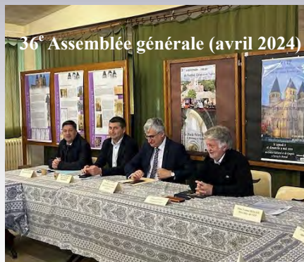
36 e Assemblée générale (avril 2024)