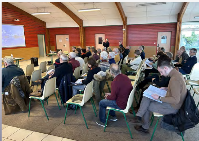
Le public lors du colloque de novembre 2024, à la salle Bel Air de Saint-Christophe-en-Brionnais

Une crise globale : Depuis plusieurs décennies, les scientifiques de tous pays tirent le signal d'alarme, et affirment que nous sommes entrés dans une crise sans précédent, dans l'histoire de l'humanité. Avec 8 milliards d'habitants sur la planète, l'humanité exerce une pression énorme et insupportable sur l'ensemble de l'écosystème « Terre » laquelle menace, à terme, l'ensemble du vivant. Tous les indicateurs socio-économiques, politiques et climatiques clignotent « dans le rouge » ; d'un bout à l'autre de la planète. Alors que pouvons-nous faire pour éviter la catastrophe annoncée...d'autant plus que nous n'avons pas de planète de rechange, contrairement aux élucubrations d'un brillant milliardaire américain...Il s'agit, avant toutes choses, de repenser l'ensemble de nos actions et de restaurer le principe de réalité.