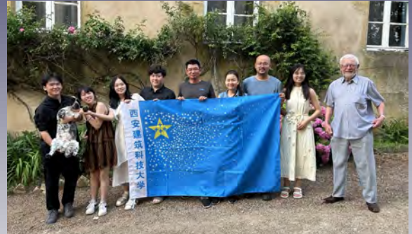
Les étudiants chinois dans la cour du Montsac (juillet 2024)