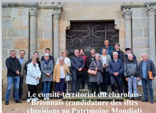
Le comité territorial du charolais-Brionnais (candidature des sites clunisiens au Patrimoine Mondial)