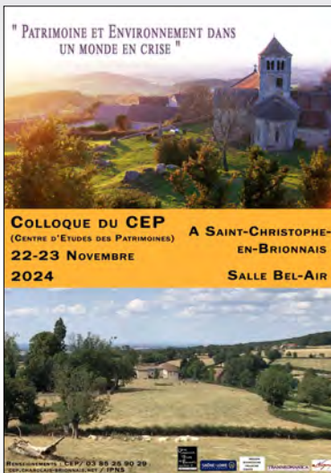
Affiche du colloque de 2024